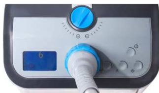
Ecran de contrôle