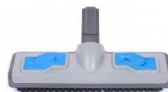
SP220 : Brosse 20cm SP230: Raclette 20cm