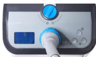
Ecran de contrôle