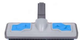
SP220 : Brosse 20cm SP230: Raclette 20cm