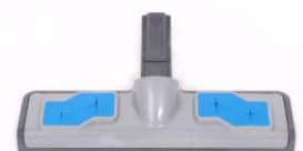
SP240 : Support microfibre 20cm